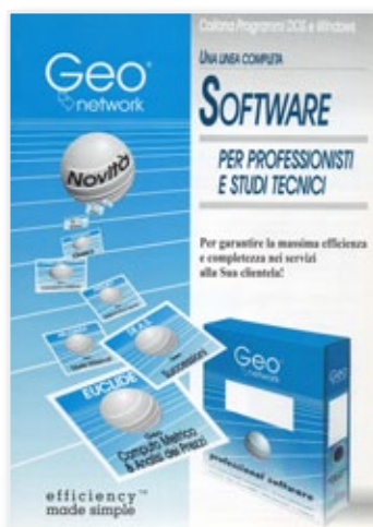
una delle prime brochure

Il nostro lavoro è iniziato con la realizzazione delle prime versioni sotto DOS di: