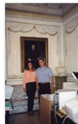
la prima sede in via Fiasella a Sarzana

Siamo solo in 5 ed il lavoro è tanto. Testiamo il mercato che risponde positivamente.